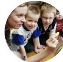
Oma elävä perintö