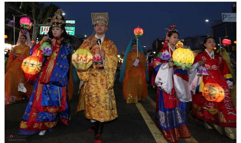
Korealainen Yeondeunghoe-festivaali